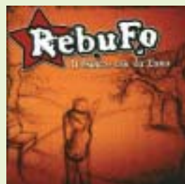
"A brincos con la luna"

Naix entre 2003 més com "una manera de passar el temps", com ells mateixos diuen. Però al juny de 2004 tenen el seu primer concert amb Sinestèsia i Malos Vicios. Des d'aleshores no han parat. Fins que el 7 de maig de 2008 trauen el seu primer disc, "A brincos con la luna", amb Flor y Nata Records. El seu estil es defineix com a rock urbà i punk.