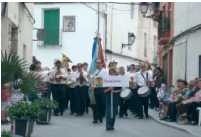
Una de les bandes de Benigànim desfilant a la XXVIII Diada Musical de la Vall d'Albaida celebrada el passat divendres 24 a Agullent