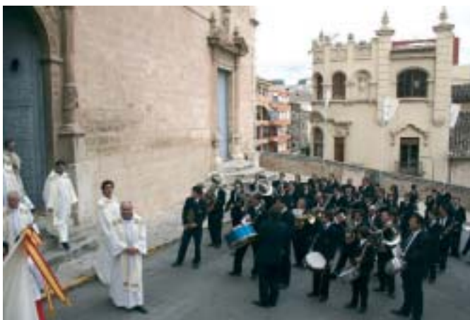
Una banda al carrer és un fet habitual. A l'imatge l'Unió Musical d'Ontinyent a la processó del Corpus Cristi