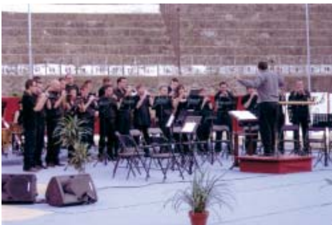
L'Aljub de Bocairent

Un dels punts de canvi més importants produïts en la dolçaina ha estat el músic. "Quan el dolçainer és músic es pot tocar de tot. Eixe és el punt d'inflexió i dignificació de l'instrument".