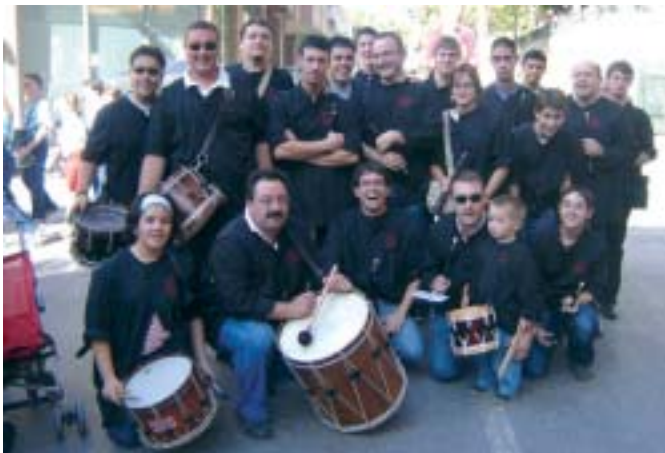
El Regall d'Ontinyent