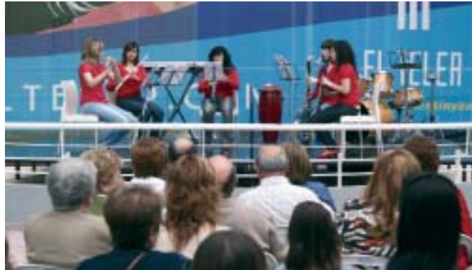
Els alumnes del Conservatori van actuar el passat dissabte, 31 de maig, a la plaça d'"El Teler" amb motiu del 10é aniversari

Una de les qüestions més evidents dels últims mesos és la gran quantitat d'activitats que el Conservatori està oferint cap a l'exterior. "Un dels objectius de l'equip directiu del centre és projectar-lo cap a la societat. No és sols la situació concreta del 10é aniversari. S'ha de tenir en compte que ha influït molt la recent inauguració