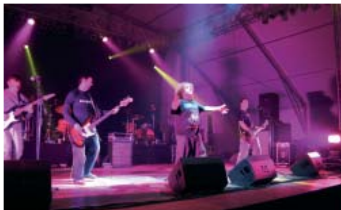
Red Roja va ser un dels grups de la Vall d'Albaida que va actuar a l'últim Festivern realitzat a Ontinyent

Hi ha més grups dels quals sols podem aportar el nom, com són: Tashkenti, l'Home del Sak, Rebel·lió Sud, Skak al rei, De la Pata el matxo, Machambrao, Criatura, Cinq, Q3, Kaos... en definitiva una possible indústria musical a explotar. Per quí?