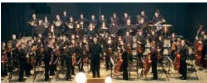
L'Orquestra Simfònica ATRIUM a l'EChegaray en l'actuació de 2007 amb 75 músics