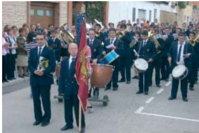
L'Agrupació musical d'Agullent va celebrar el seu 125 aniversari organitzant una Diada musical amb un 92,35 % de participació